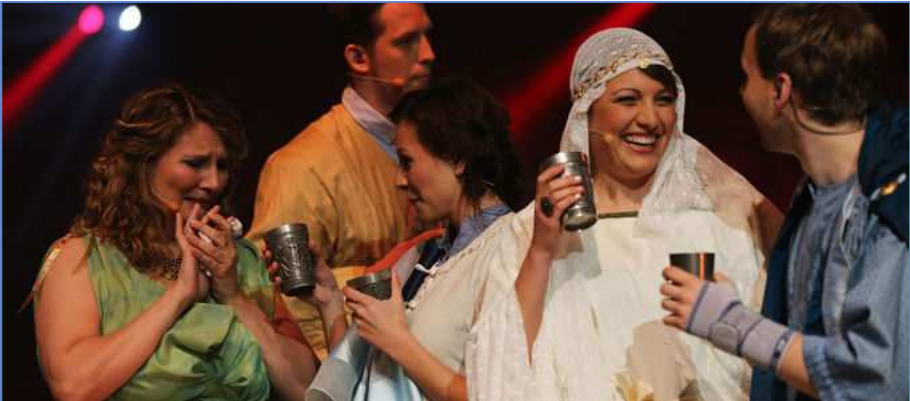
Biblische Szenen wie das Weinwunder bei der Hochzeit zu Kana zeigte 2013 das Pop-Oratorium der NAK Nord und der NAK NRW.

Natürlich sind viele biblische Begebenheiten grundsätzlich bekannt. Doch wer tiefer gräbt, kann neue Schätze heben. Vor diesem Hintergrund startete die Gottesdienst-Themenreihe „Bibelkunde“: In dem Wochengottesdienst am 18. Februar 2015 ging es um das Gleichnis von der königlichen Hochzeit und vor allem um das „hochzeitliche Gewand“ (Matthäus 22,11.12).