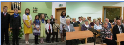
Freudenstifter am Muttertag (2012)

Ein besonderes Ereignis war das Konzert des Bezirkschores und -Orchesters am 21.05.2000 . Von den 507 Konzertbesuchern konnten 100 Gäste begrüßt werden.