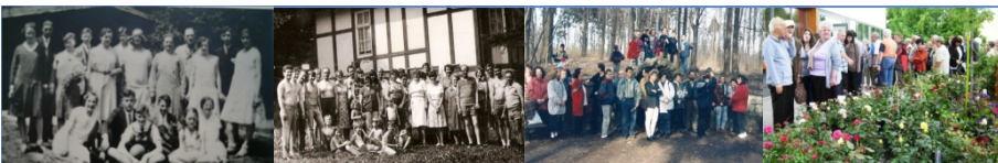
Gemeindeausflug in 1925 sowie zum Wackenhof (1981), auf dem Krahnberg (März 1997) und zum Rosarium (Juni 2012)

In den 110 Jahren, die unsere Gemeinde besteht, wurden auch etliche Ausflüge durchgeführt. Sie stärkten unsere schöne Gemeinschaft, es gab immer viel Freude und schöne Erlebnisse.