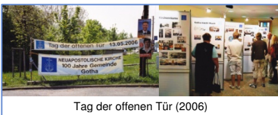
Tag der offenen Tür (2006)

Zum Muttertag erfreut der Kinderchor alle Mütter, Omis und die ganze Gemeinde mit einem kleinen Programm.