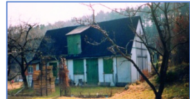
Die legendäre „Hütte“ auf dem Seeberg 1970