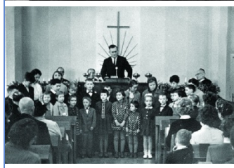
Unsere Kinder 1926, 1953, 1964