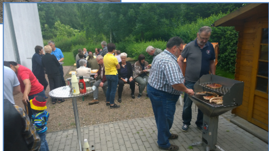
(Text: Ha. Hä.)

Ein herzliches Dankeschön an alle Mitwirkenden; so stand es im Herzen unseres Vorstehers. Die Chorproben beginnen wieder am 08.August 2016.