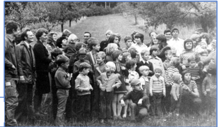
Kinderfest auf dem Seeberg 1976 und 1995

Meistens im August/September wurden Kinderfeste auch auf Bezirksebene organisiert. Bei Sport und Spiel, Wissenstest und kleinen „Theater“-Aufführungen hatten die Kinder viel Spaß und Freude in der schönen Gemeinschaft.