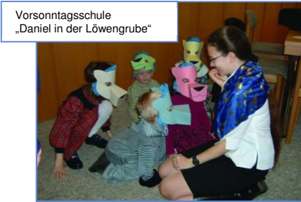
Vorsonntagsschule „Daniel in der Löwengrube“

Besonders liebevoll wurden und werden unsere Kinder betreut. Im GB 02/2016 war zu lesen, wie viele Kinder in den verschiedenen Zeitabschnitten unsere Gemeinde belebten. Sie wurden in der Sonntagsschule, Vorsonntagsschule, Religionsunterricht und Konfirmandenstunde mit unseren Glaubensinhalten und den „Hausregeln“ Gottes vertraut gemacht.