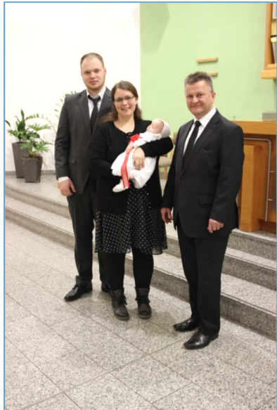
(Text: M. Schw.)

In seiner Ansprache an die Eltern brachte der Bezirksälteste Schneider seine Freude über die Heilige Wassertaufe zum Ausdruck. Der Glaube, der in dem Kindchen wachsen soll, ist kein Nachteil für das Kind sondern ein Geschenk. So wie das Kind jederzeit zu den Eltern kommen kann, darf es auch zu Gott kommen. Er wird als Gott der Vater beschrieben und ist die Liebe. Durch die Taufe erfährt das Kindlein die Liebe Gottes und kommt hinein in die Schar der Christen. Nach der Ansprache an die Eltern empfing der Täufling das Sakrament der Heiligen Wassertaufe und im Anschluss feierten alle das Heilige Abendmahl. Nach Abschluss des Gottesdienstes nahmen die Eltern die Glückwünsche der Gemeinde entgegen.