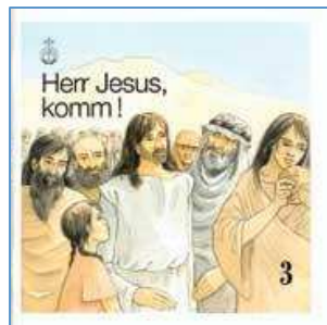
(Text: A. Schw.)

Über die Abfahrtszeit werden die Kinder und deren Eltern von ihren Betreuern noch informiert. (Ansprechpartner Di Schneider)