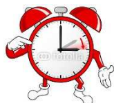
(Text: A. Schw.)

Die Uhren werden um zwei Uhr morgens um eine Stunde vorge stellt - die Nacht "verkürzt" sich also entsprechend.